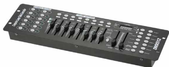
Console 192 DMX