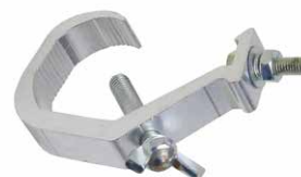
Algema dupla 250kg