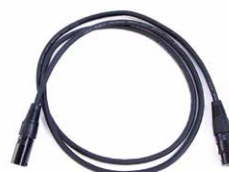
Cabo Rede RJ-45 CAT6 1.5m