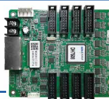
Receiving Card Novastar DH7508