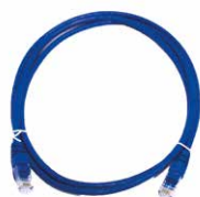
Cabo DMX XLR 3 Pinos 1.5m