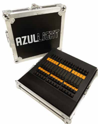
Mesa de Iluminação Fader Wing