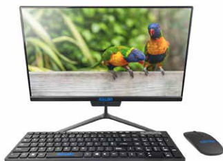
Teclado e Mouse sem fio inclusos!