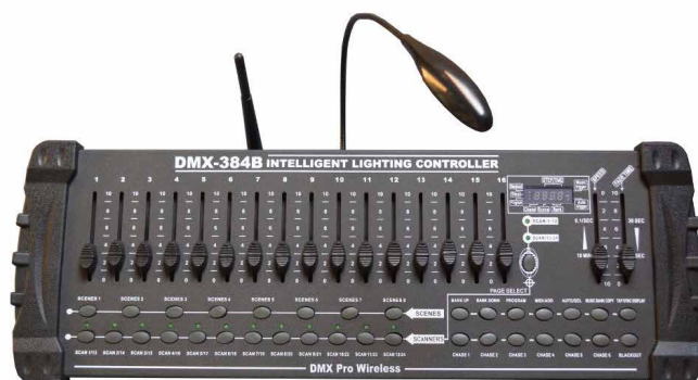
CONSOLE 384B DMX