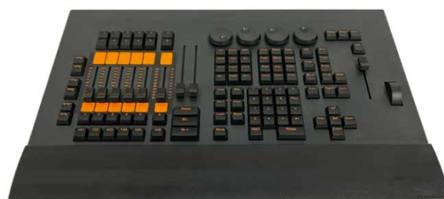
Mesa de Iluminação Command Wing