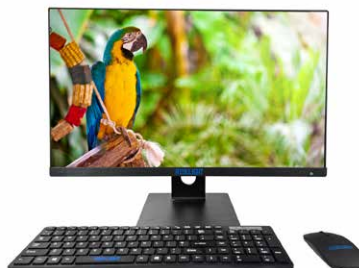
Teclado e Mouse sem fio inclusos!