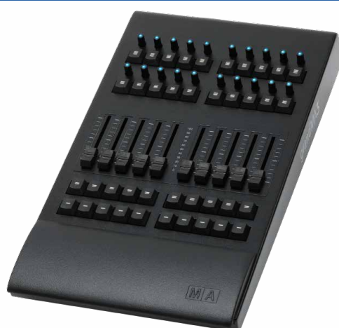
Console fader Wing DMX Com Case